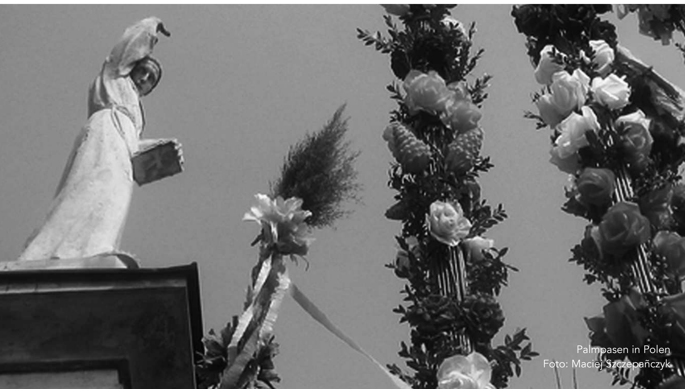
Palmpasen in Polen

Secretariaat RKK, Postbus 13049, 3507 LA Utrecht