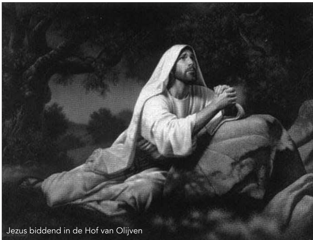
Jezus biddend in de Hof van Olijven

Memento mori betekent niet alleen dat je de gestorvenen moet gedenken, maar vooral ook je eigen dood. Dit besef van eindigheid en sterfelijkheid leidt niet tot apathie, lusteloosheid of fatalisme. Jezus verlangde er niet naar te sterven, Hij vreesde zijn noodlot. 'Gedenk dat gij stof zijt en tot stof zult wederkeren.' Vergeet in deze Vastentijd niet te sterven, maar vooral ook niet om te leven.