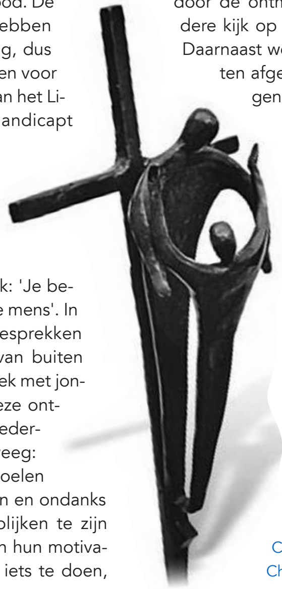
Foto: Kruisbeeld uit het stiltecentrum van de penitentiaire inrichting De IJssel in Krimpen aan de IJssel van kunstenaar Carol Cairns: De gekruisigde Christus die de medemens omarmt; onthuld op 31 januari 2009.

door de ontmoeting een heel andere kijk op jongeren in detentie. Daarnaast wordt de wijze van vasten afgesproken: op weekdays niet snoepen. Het uitgespaarde geld wordt overgemaakt aan een kinderproject in Bangladesh. Dat gebeurt ondanks het feit dat snoepen door jongeren juist als troost wordt ervaren.