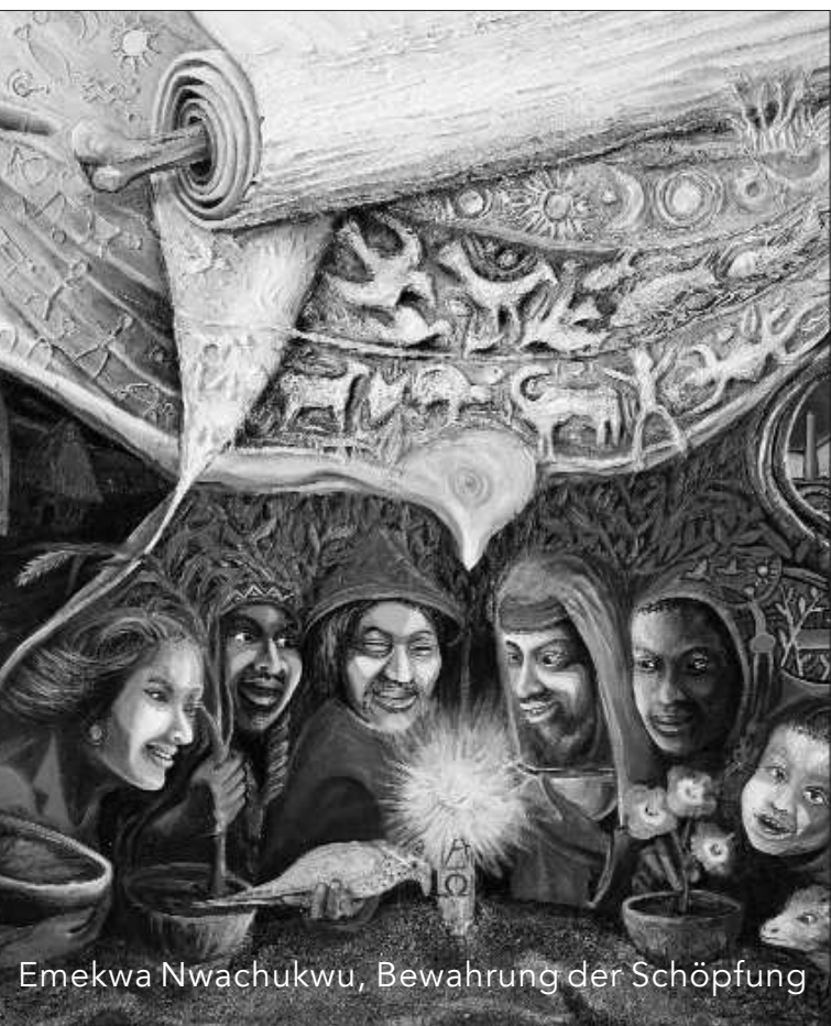
Emekwa Nwachukwu, Bewahrung der Schöpfung

een Engelse kloosterorde. Een groot probleem in deze regio is de aidsproblematiek met als gevolg dat veel weeskinderen en vrouwen met hiv besmet zijn. 'Children in Distress' richt zich op de opvang van weeskinderen, scholing van alle kinderen, scholing van volwassenen, verbetering van de voedselvoorziening en een veeteeltproject. Dit project richt zich op het voorzien van de deelnemende vijftig dorpen van ezels en geiten. Met de melk hiervan kan de borstvoeding van door hiv besmette moeders worden vervangen, zodat de kinderen niet ook besmet worden.